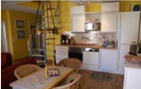
Küche mit Esstisch