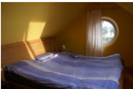
Schlafgalerie mit Meerblick

Adresse: Brigitte Oppenhäuser 23999 Kirchdorf/Poel Am Schwarzen Busch Sonnenweg 5 Tel. 038425 42032